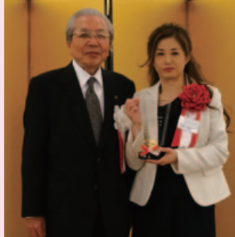
マミーズアワーズプロジェクト