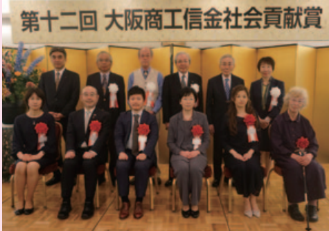
第12回「大阪商工信金社会貢献賞」表彰式