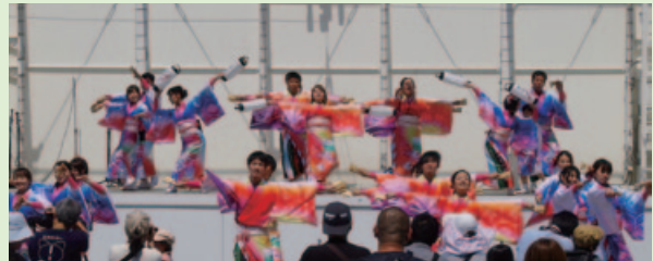
「夢源風人」(よさこい)によるステージパフォーマンス