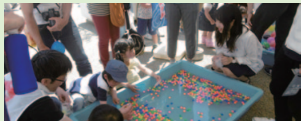
スーパーボールすくい(高井田支店)

明るい未来を目指し、人と人とのつながりによる復興支援の輪を広げたいとの思いから「チャリティーフェス ひろがる2017」を西梅田スクエア(旧大阪中央郵便局跡地)で開催いたしました。