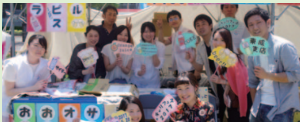
生ビール・ソフトドリンク販売(東成支店)